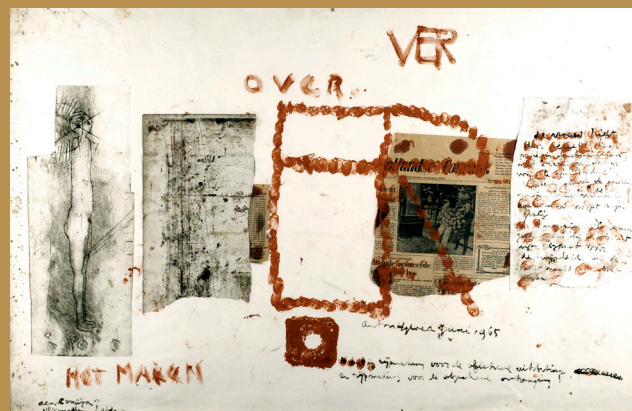
Versmolten beeld, 1965 coll: R. Kok, Zwolle

derde en de vierde International Biennale of Prints in Tokyo (1960, 1962 en 1964), de Premio Marzotta (1964).