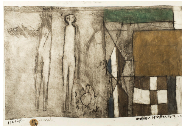
Compositie met figuren en ruiten, 1960 coll: K. Lescorenez, Rupelmonde, BE